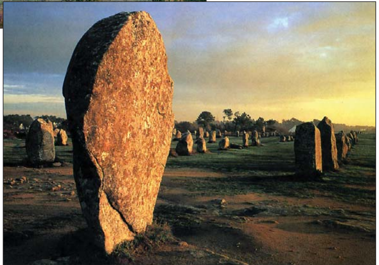
Steinreihen in Carnac