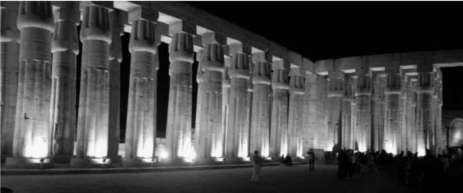
Luxortempel bei Nacht

Feste oder die heilige Geographie erkennt, so kann man doch keinesfalls die bewundernswerte Effizienz dieses politischen, wirtschaftlichen und sozialen Systems leugnen; ebenso wenig die Wichtigkeit und Größe dessen, was diese Menschen technisch umgesetzt haben.