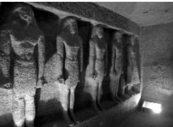
Grabkammer in Sakkara/Memphis

Diese antiken Genies tauchten zyklisch auf, als würden sie dem Wind der Geschichte und dem Rhythmus der Natur folgen. Sie traten nicht nur aufgrund ihrer Intuition hervor, sondern auch durch ihre Fähigkeit zu schaffen, zu erklären und die Religion und die Kunst als Vermittler zu benutzen.