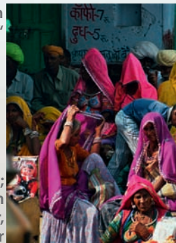
Pilgerfest Pushkar Mela; Bemalte Elefanten – Palastanlage von Amber, nahe Jaipur

dem Buddha lebte und lehrte und dessen religiöse Feste so alt sind wie seine Lebenspendenden Flüsse, ist der zweitgrößte Computersoftware-Hersteller der Welt mit eigenen Satelliten und Atomwaffen. Indien hat eine Bevölkerung von einer Milliarde Menschen und ein wahnsinniges Wirtschaftswachstum. Die materialistische Konsumgesellschaft konnte ich im pulsierenden Kaufrausch der Großstädte täglich erleben. Auch vor Indien hat die Globalisierung nicht Halt gemacht, es gibt Fast-Food-Ketten, internationale Coffee Shops und Modemarken, die zunehmend Beliebtheit bei den jungen Leuten finden.