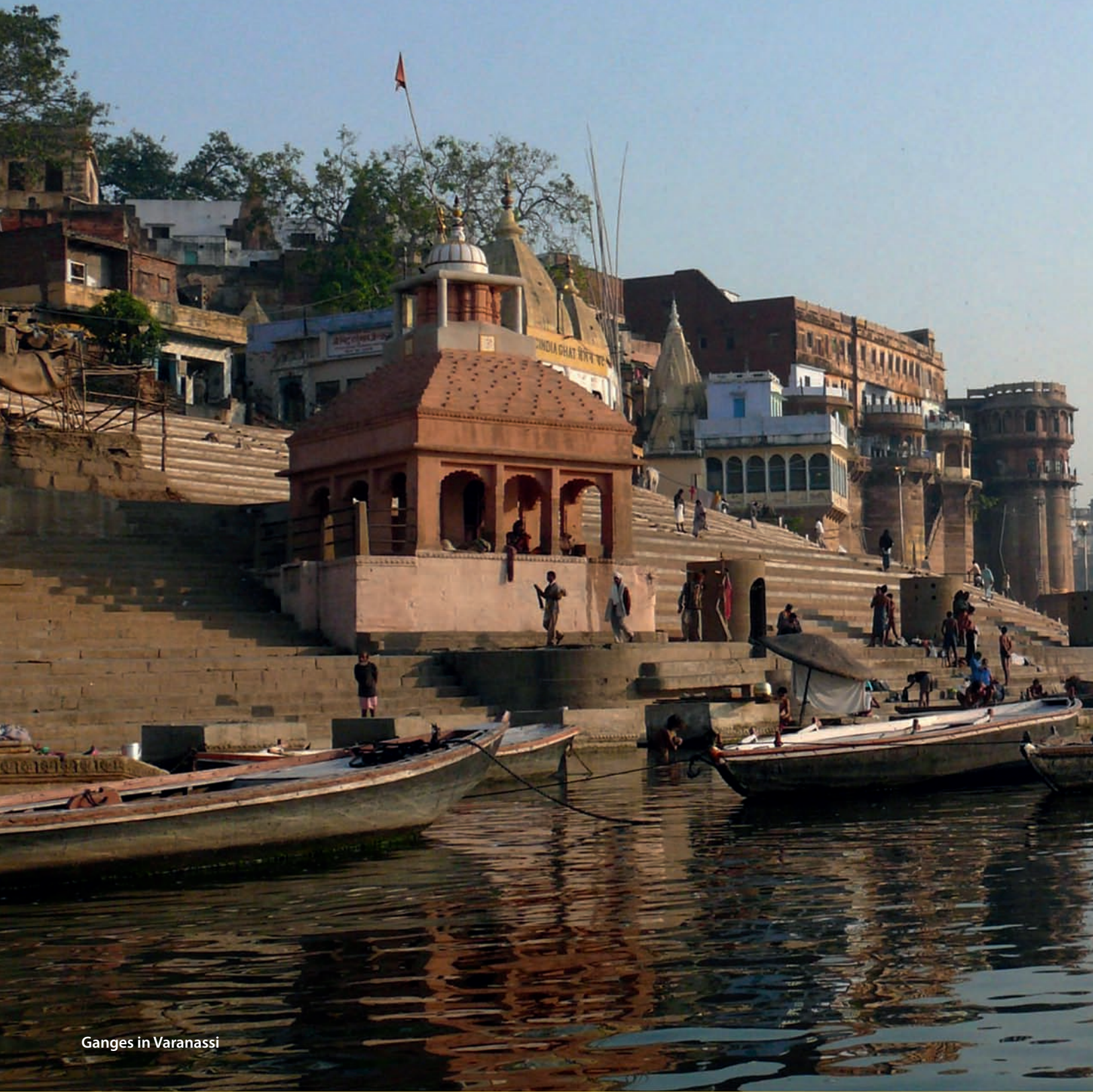
Ganges in Varanasi