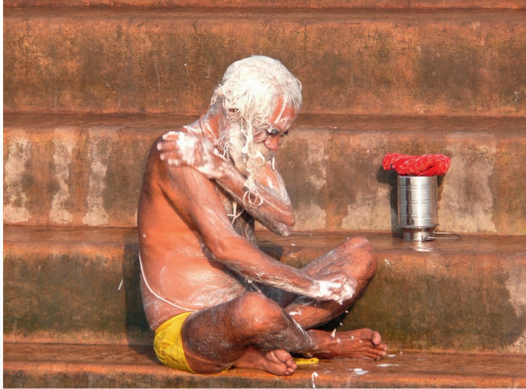
Von links nach rechts: Rituelle Waschung am Ganges; Taj Mahal am Morgen; Dilwara-Tempel der Jain – „ein Traum in Marmor“

Meiner Meinung wird Indien dabei noch völlig unterschätzt. Ich finde es erstaunlich, dass Indiens Vergangenheit noch so lebendig ist. Denn Wirtschaftsreformen haben Indien bis dahin unbekannte Konsumgüter, neue Technologien und eine drastische veränderte Lebensweise beschert. Das Land, in