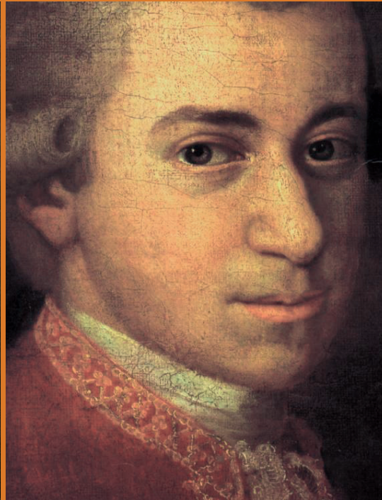
Mozart zirka 1780, portraitiert von Johann Nepomuk della Croce