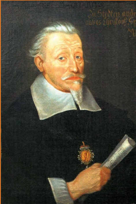
Heinrich Schütz portraitiert von Christoph Spetner um 1660