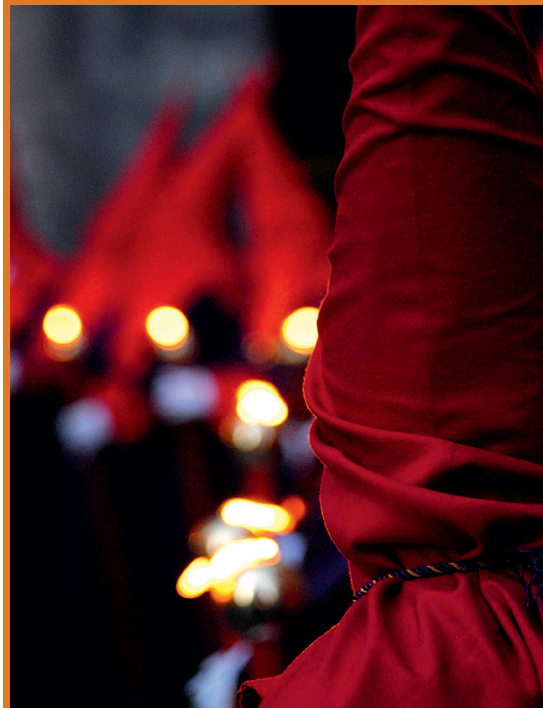
Die „musikalischen Totenmessen“, Lehrstücke für Lebende.