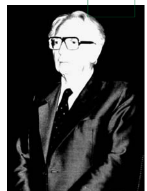
Von der Verantwortung ...