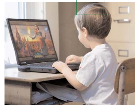
Kindheit online ...