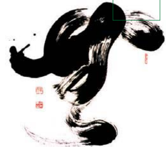
ab Seite 22