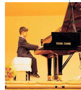
ab Seite 12