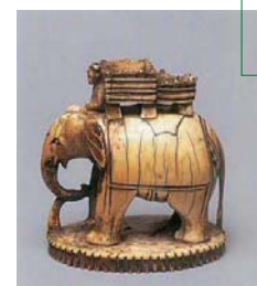
ab Seite 38